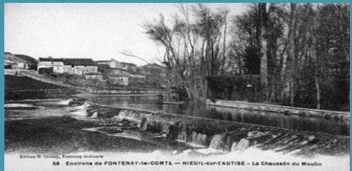
Éditions M. Corré, Trémozay Joazeux 58 Environs de FONTENAY-la-COITE - NIEUL-sur-l'AUTISE - La Chaussée du Moulin

Discover the monuments and emblematic sites of south Vendée in 1920. Free.